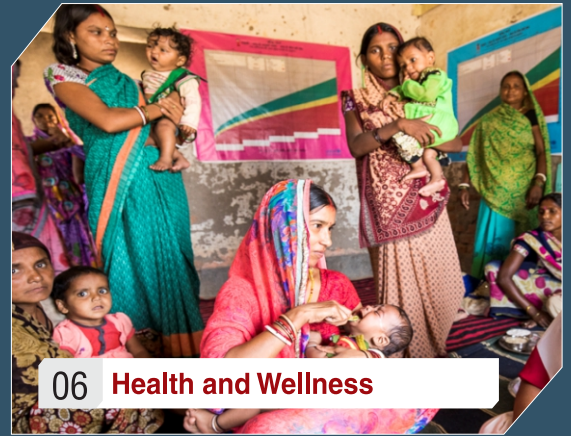
06 Health and Wellness