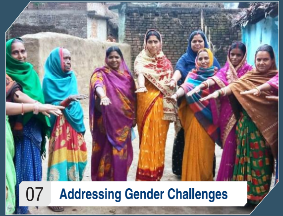
07 Addressing Gender Challenges