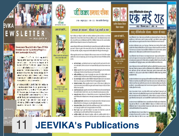
11 JEEVIKA's Publications