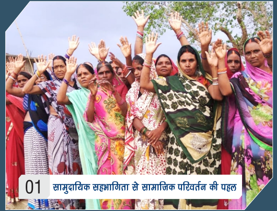
01 सामुदायिक सहभागिता से सामाजिक परिवर्तन की पहल